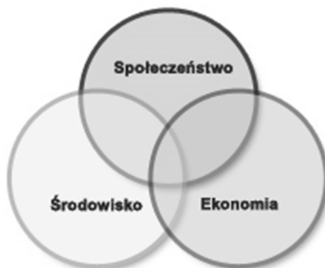
Rys. 1. Model zrównoważonego rozwoju

Uproszczony model zrównoważonego rozwoju przedstawia Rysunek 1.