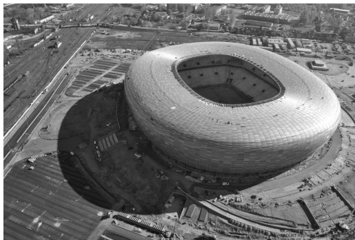
Rys. 1. Stadion w Gdańsku

Stadion piłkarski w Gdańsku 7 przedstawiony na rys. nr 1 został zbudowany w latach 2008 - 2011 w związku z wybraniem miasta Gdańska na miasto gospodarza na mistrzostwa EURO 2012. W ramach prowadzonych badań działań społecznie odpowiedzialnych analizowano etap przygotowania terenu do budowy oraz etap realizacji prac ziemnych.