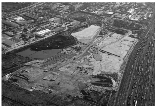
Rys. 2. Teren budowy przed rozpoczęciem prac ziemnych

Pierwszym etapem budowy stadionu były prace ziemne w ramach których wymieniono grunt, wykonano melioracje i wyrównano teren (por. rys. nr 2 oraz nr 3). Wymiana gruntu polegała na jego wywiezieniu do żwirowni pod Gdańskiem i przywiezieniu stamtąd żwiru i umieszczeniu jego w miejsce oryginalnego gruntu. Żwirownie znajdowały się ok 35 - 40 km od miejsca budowy. Prace transportowe wykonywano ok. dwustoma wywrotkami (w kolorze niebieskim) które pracowały przez całą dobę, sześć dni w tygodniu przez prawie pięć miesięcy.