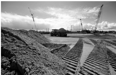
Rys. 3. Teren budowy prace ziemne

Inwestor oraz firmy wykonawcze zdawały sobie sprawę, że budowa zawsze jest uciążliwa dla okolicznych mieszkańców, więc prace przy wymianie gruntu prowadzono w taki sposób, aby zminimalizować wszelkie niedogodności które mogłyby się pojawić dla społeczności lokalnej, np.: